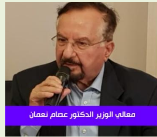
معالي الوزير الدكتور عصام نعمان

معالي الوزير الدكتور عصام نعمان - منسق عام الحركة الوطنية للتغيير الديمقراطي وعضو مجلس امناء التجمع بدوره، أشار معالي الوزير نعمان الى ان قضية العرب في فلسطين في كل مرحلة لها مفهومها ومرتكزها الاساس، وفي هذه المرحلة فان القضية تعني بالدرجة الاولى ارادة المقاومة ومنهجها، وما ترمي اليه هذه الصفقة هو تعطيل هذه الارادة وقتلها عند العرب عموما والفلسطينيين خصوصا.