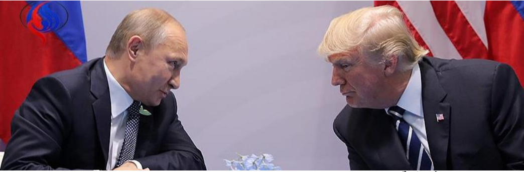
من سيعطي من؟ في قمة ترامب - بوتين