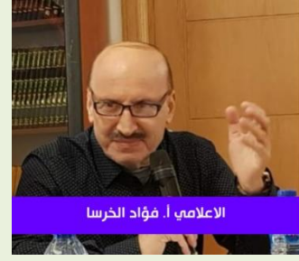
الإعلامي أ. فؤاد الخرسا